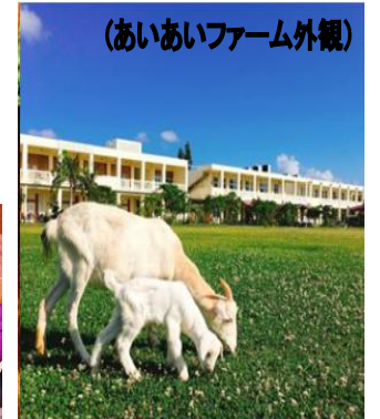
(あいあいファーム外観)