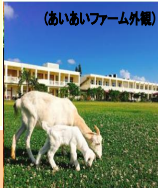
(あいあいファーム外観)