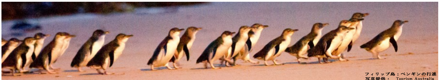
フィリップ島: ペンギンの行進 ※写真はすべてイメージです。