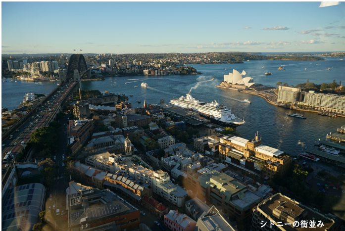
シドニーの街並み