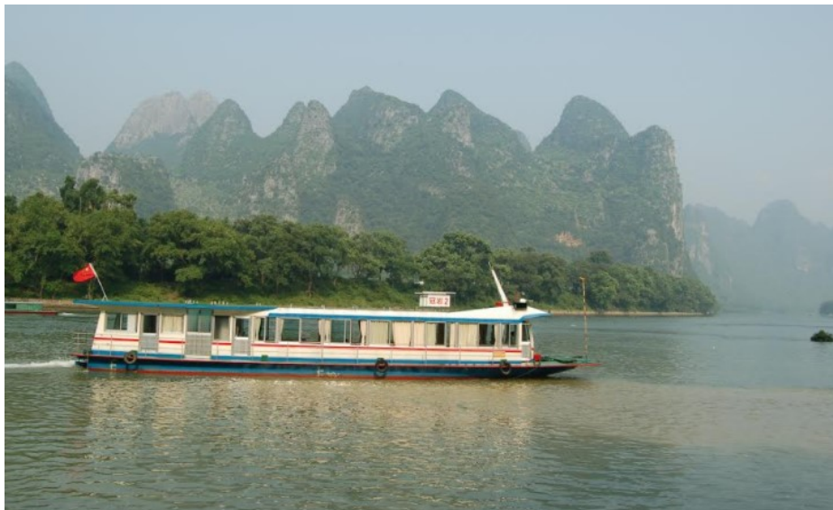
※時間や天気でのいろいろな表情を見せる桂林。写真は漓江のイメージ写真です。