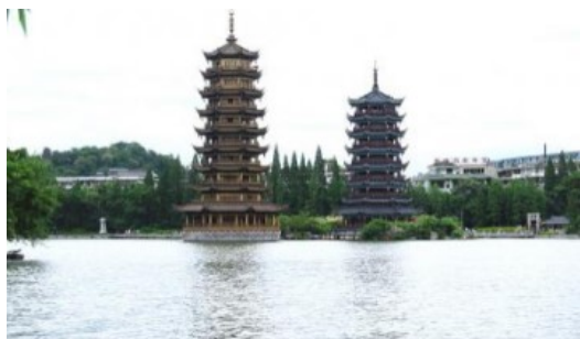
日塔・月塔(イメージ)

※燃油付加運賃・空港税、国際旅客観光税など諸税合計 約¥9,500(4/1現在)は別途必要です。 ※出入国書類作成料は、別途¥1,000にて承ります。