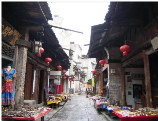
大墟古鎮(イメージ)