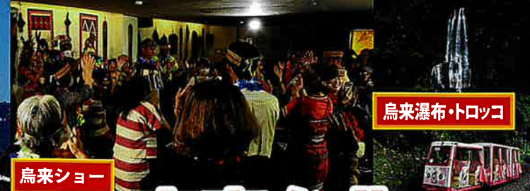
烏来瀑布・トロッコ