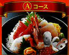
気仙沼の海鮮料理