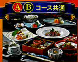
ホテル華の湯夕食