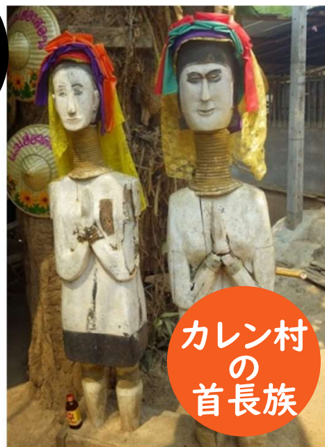
カレン村の首長族