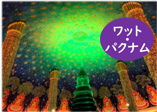
ワット・パクナム