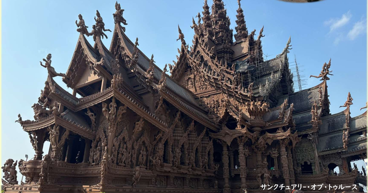
サンクチュアリー・オブ・トゥルース