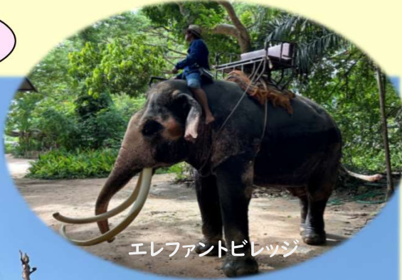
エレファントビレッジ