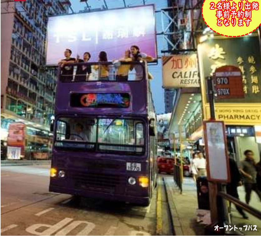
オープントップバス