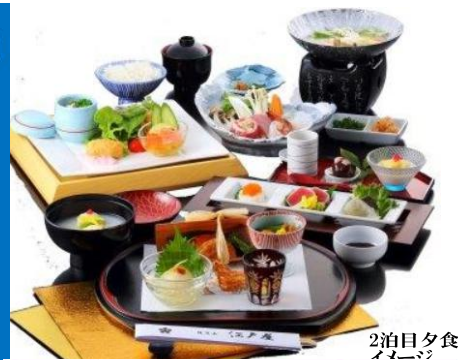
2泊目夕食 イメージ