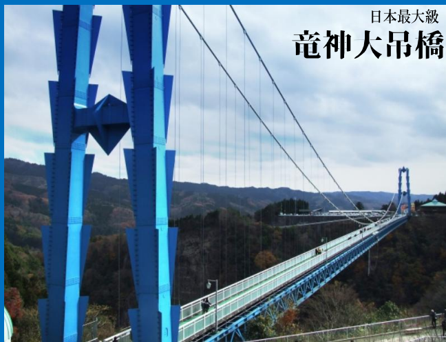
日本最大級 竜神大吊橋