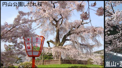
円山公園しだれ桜