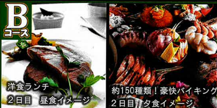
洋食ランチ 2日目 昼食イメージ