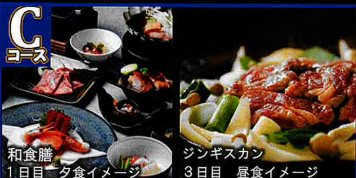
和食膳 1日目 夕食イメージ