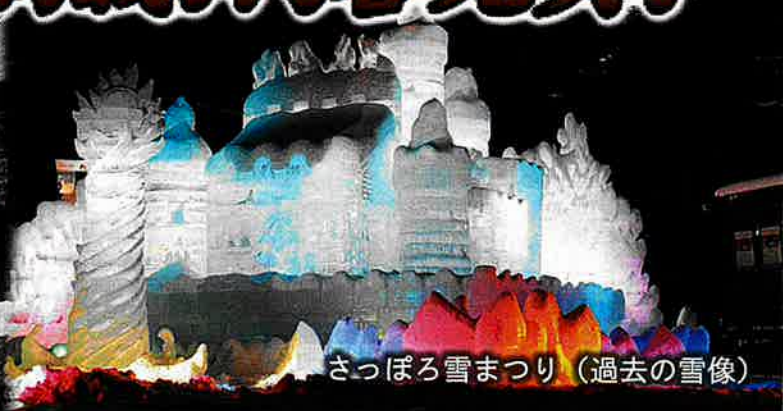
さっぽろ雪まつり (過去の雪像)