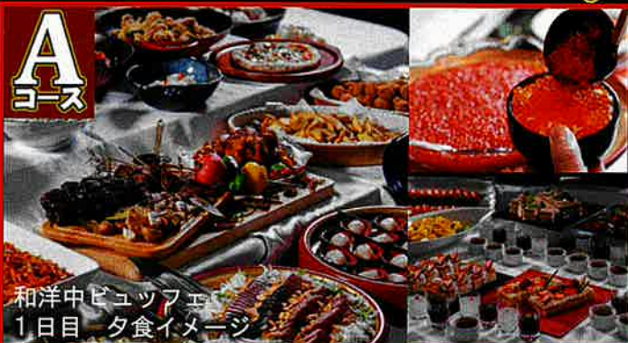
和洋中ビュッフェ 1日目 夕食イメージ