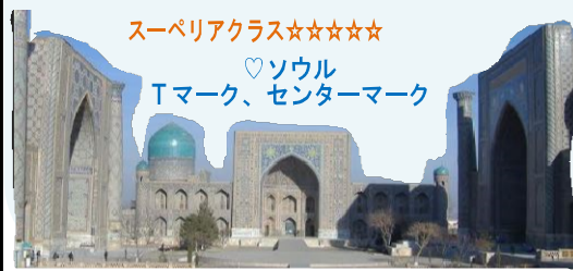
サマルカンド・レギンス広場

※お客様の状況によっては当初の手配内容に含まれていない特別な配慮、措置が必要となる可能性があります。詳細は「旅行条件書」の「3.お申し込み条件・契約締結の拒否」をご確認の上、特別な配慮・措置が必要となる可能性がある方はご相談させて頂きまますので、必ずお申し出下さい。