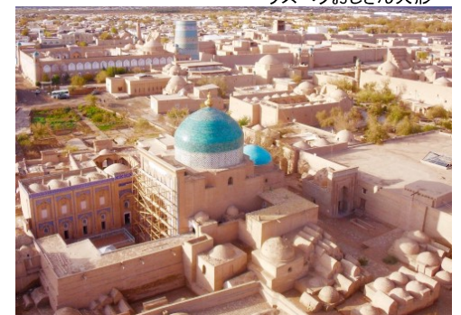
世界遺産ヒバの街並み