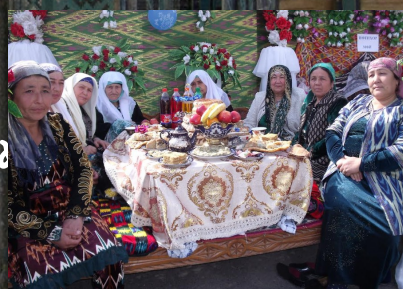
※サマルカンド・シャーヒズンダ廟群写真はイメージです。