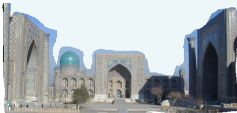
サマルカンド・レギンス広場