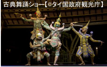
古典舞踊ショー【タイ国政府観光庁】 ※掲載写真はイメージとなります。ご旅行の参考にご覧ください。

ピンクのガネーシャ 緑のワットパクナム カレン族の村訪問(首長族) 象乗り体験・水上マーケット