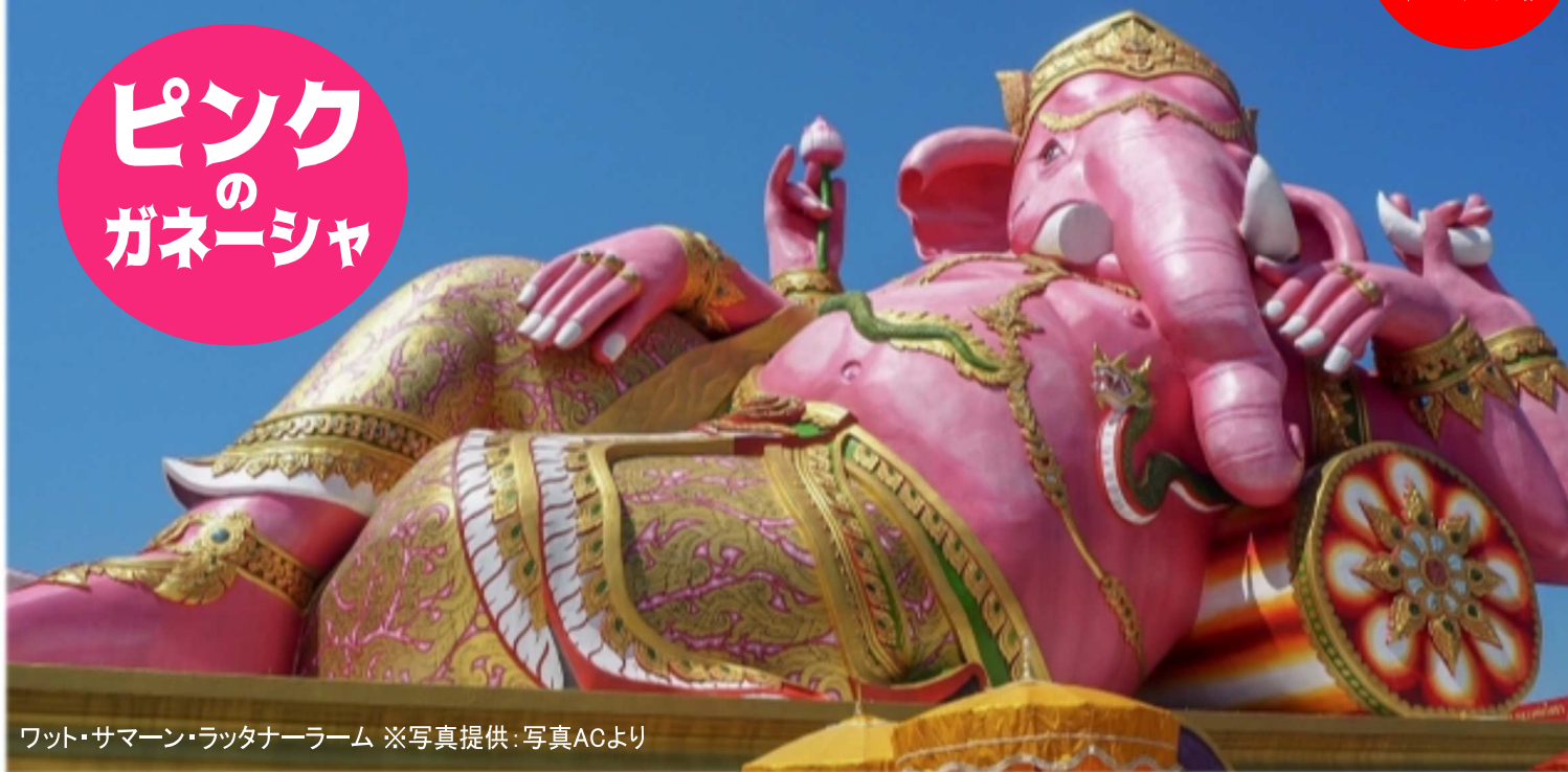
ワット・サマーン・ラッタナーラーム