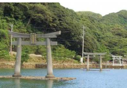
対馬:和多都美神社