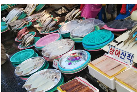
釜山:チャガルチ市場