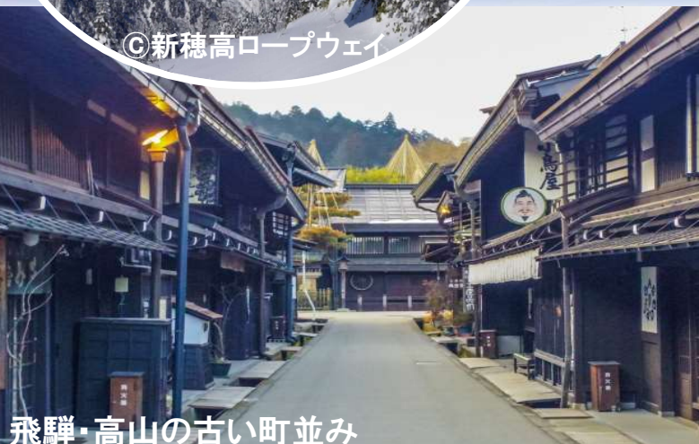
飛騨・高山の古い町並み