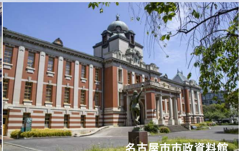
名古屋市市政資料館